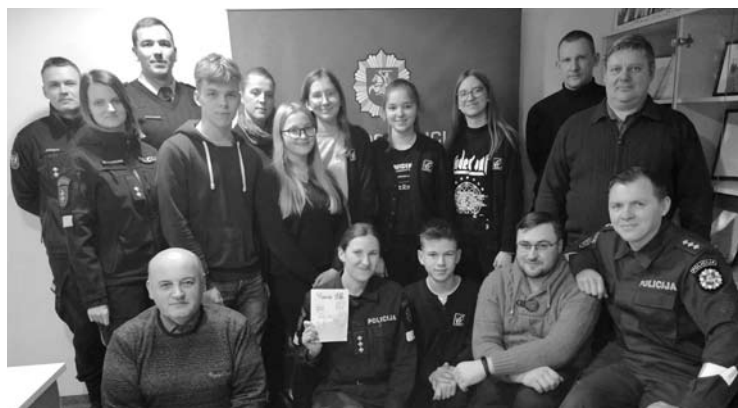
Policininkai šiemet Vasario 16-ąją minėjo kartu su moksleiviais.