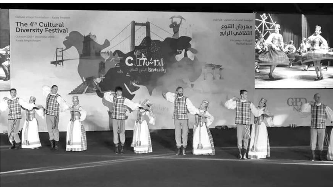
Šokių ansamblio „Gojus“ kolektyvo nariai feisbuke dalijasi išpuščiais iš festivalio Katare.

Anykščių Kultūros centro šokių ansamblis „Gojus“ viešėjo Katare, kur dalyvavo Kataro vyriausybės organizuotame tarptautiniame festivalyje.